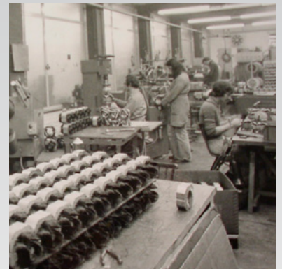
20世纪60年代的电机生产

我们的电机符合IP55认证，也就是说，不可能有大量的雾水或灰尘进入电机。然而，仅仅因为凝结，每年就有大约0.5升的水流经这种类型的电机。因此，必须使潮湿的空气从电机中逸出。为此，我们开发了特殊的排水槽，大大延长了电机的使用寿命。