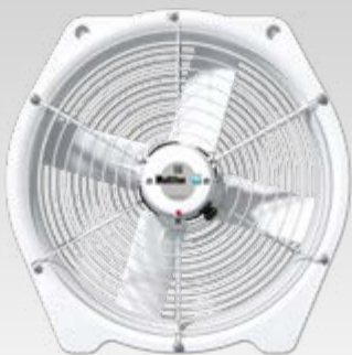
Ventilador para horticultura de 45 cm.